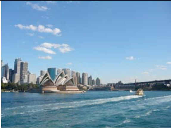
Image bateau, peut-être trop classique...