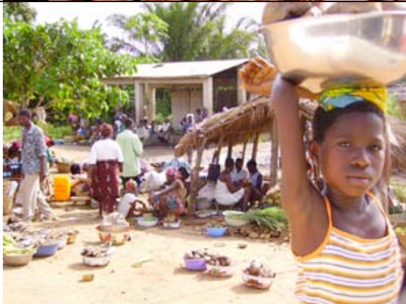
Photo où l'enfant se heurte au bord droit, mais cela permet de voir l'ambiance. Dommage que l'image soit surexposée.

1 Dommage que le plan ne soit pas plus large, mais belle photo où la femme ressort bien.